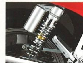
Der 5fach verstellbare Stoßdämpfer

Sie haben absolut Recht, endlich die Suzuki VX 800 haben zu wollen. Denn diese Maschine hebt sich mit ihrem unverfälschten Technik-Verständnis wohltuend vom alltäglichen Einerlei ab. Massive Verarbeitung, klassisches Design, technische Raffineszen – all das muß man erst einmal erfahren haben, um darauf voll abzufahren. Ihr Suzuki-Händler hilft Ihnen gern dabei. Besuchen Sie ihn bald. Er freut sich darauf, Ihnen die genauen Einzelheiten detailliert zu erklären. Viel Spaß mit der VX 800.